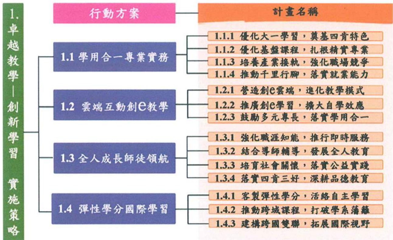
「卓越教學—創新學習」實施策略之行動方案與計畫名稱關聯圖