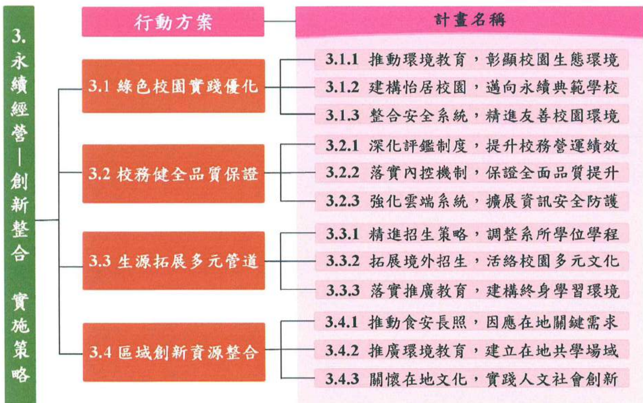
「永續經營—創新整合」實施策略之行動方案與計畫名稱關聯圖