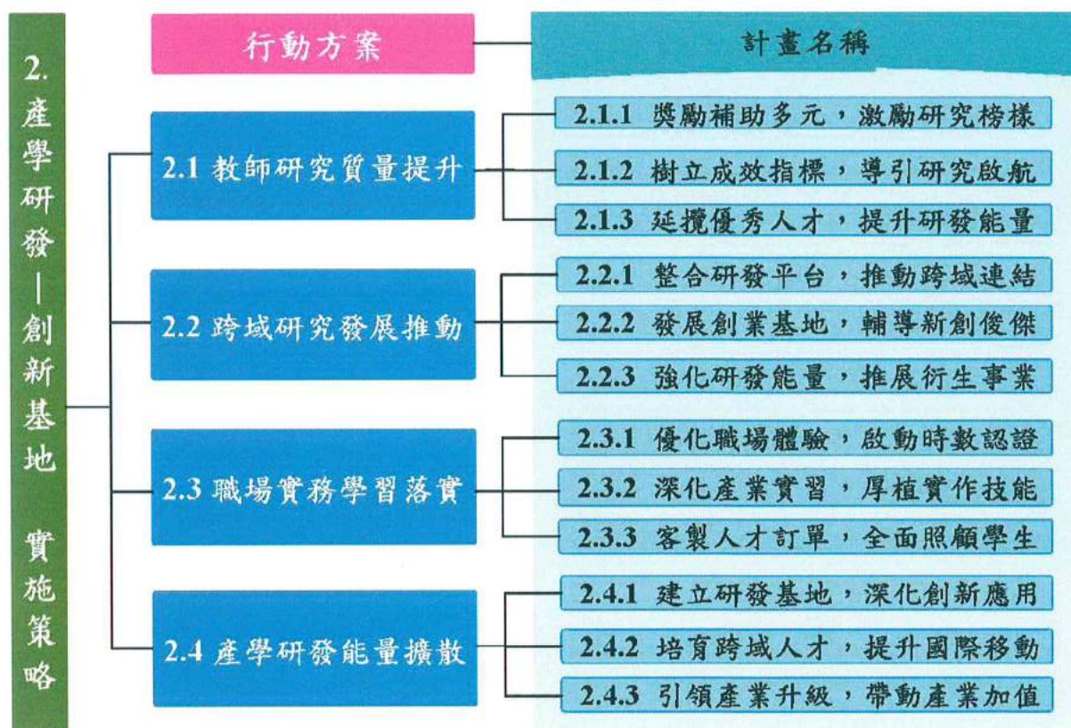
「產學研發—創新基地」實施策略之行動方案與計畫名稱關聯圖