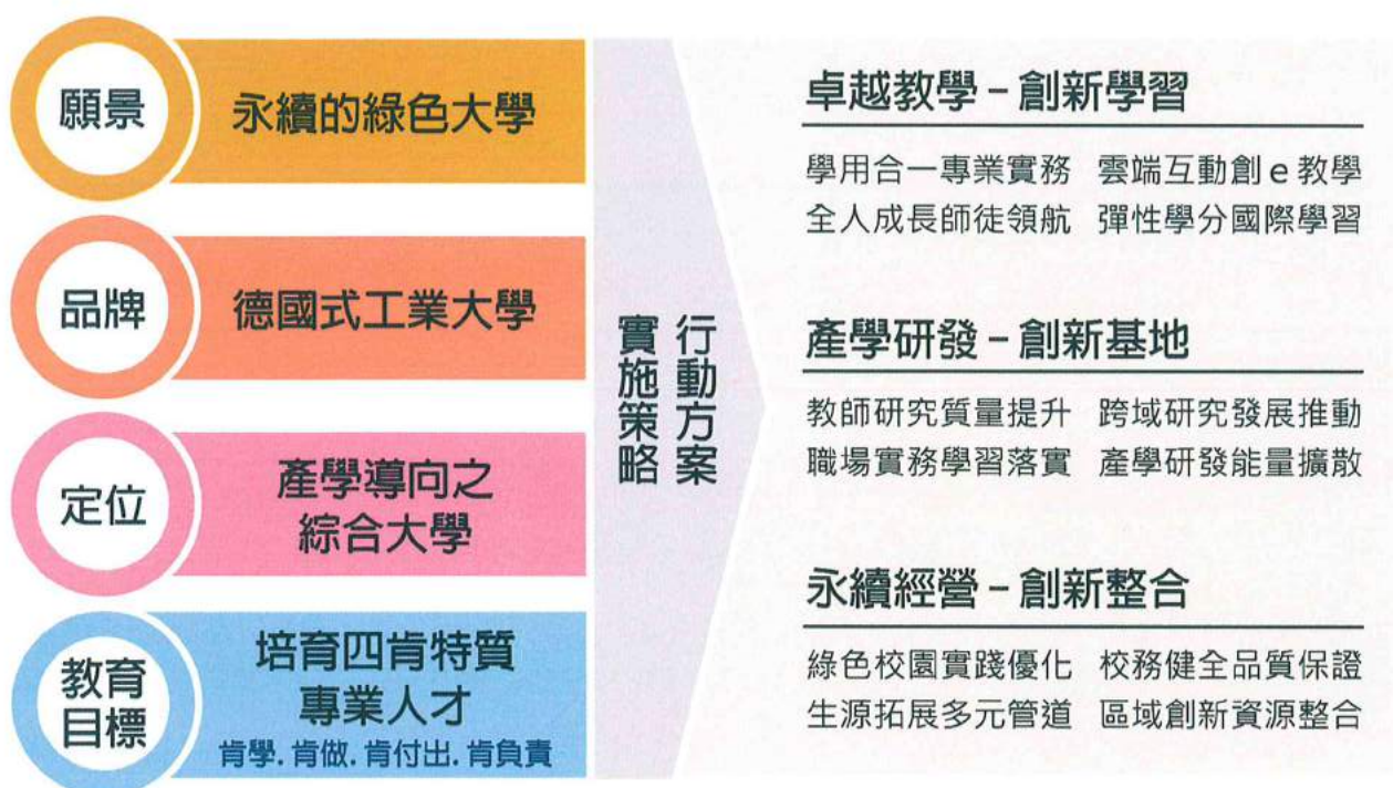
106-108 學年度校務發展架構圖

本校建置高品質之教學與研究環境，營造學生能夠充分發揮想像力與創造力之空間，以培養高創力及豐富科學內涵之專業人才。貫徹「理論與實務並重」、「人文與科技整合」、「師傅與徒弟傳承」及「產業與學術合作」之教育理念，推動住學合一之「四肯書院」機制，養成具備肯學、肯做、肯付出、肯負責之四肯特質專業人才。秉持「產學導向之綜合大學」定位，邁向「永續的綠色大學」之願景。本校 106-108 學年度校務發展架構如下圖所示。