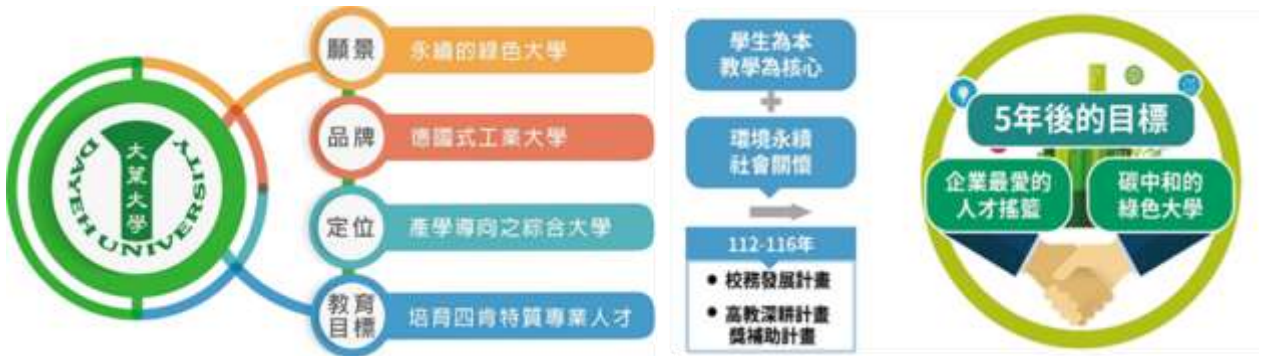
圖(1) 學校定位與校務發展目標

本校建置高品質之教學與研究環境，營造學生能夠充分發揮想像力與創造力之空間，以培養高創造力及豐富科學內涵之專業人才。貫徹「理論與實務並重」、「人文與科技整合」、「師傅與徒弟傳承」及「產業與學術合作」之教育理念，推動四肯教育養成學生肯學、肯做、肯付出、肯負責的精神，以培育具四肯特質之專業人才。秉持「產學導向之綜合大學」定位，邁向「永續的綠色大學」之願景。學校定位與校務發展目標如圖，學年度校務發展計畫核心基礎如圖所示。