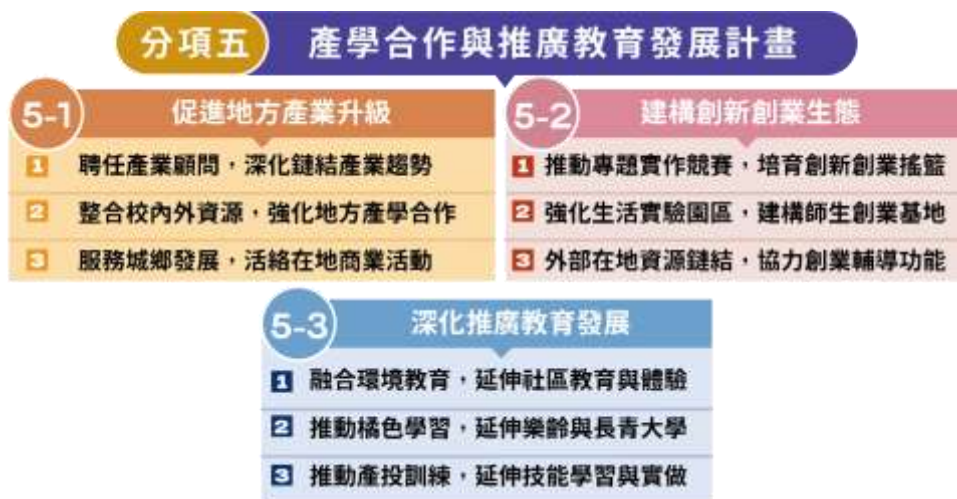
圖(10) 產學合作與推廣教育發展計畫架構圖