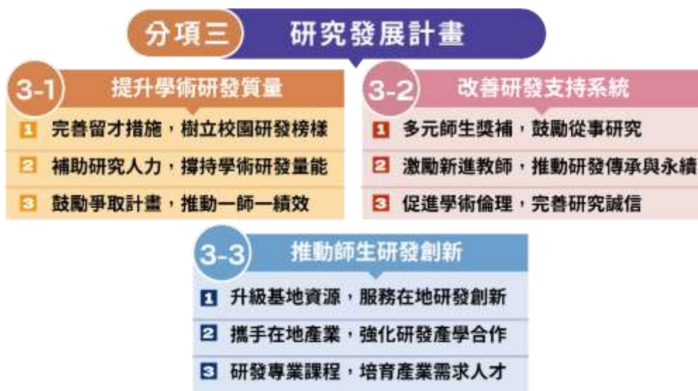
圖 8 研究發展計畫架構圖