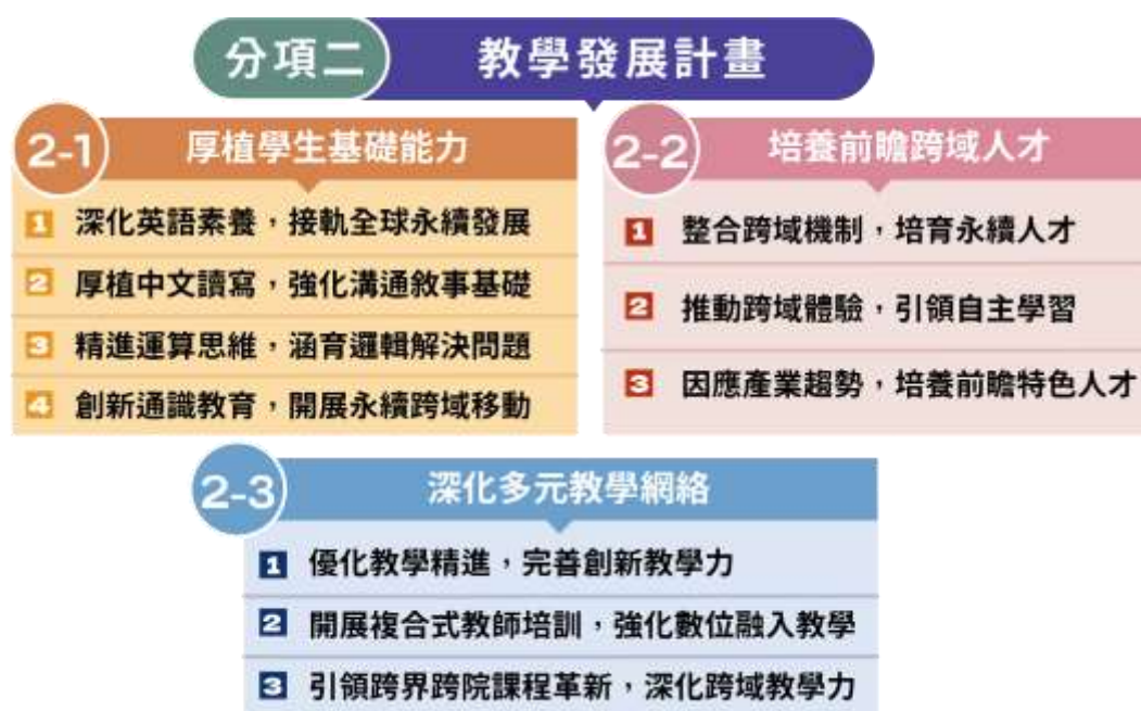
圖(7) 教學發展計畫架構圖