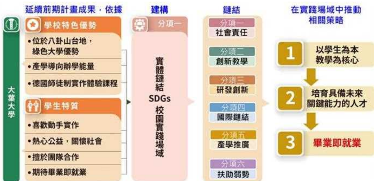
圖(2) 112-116 校務發展計畫核心基礎