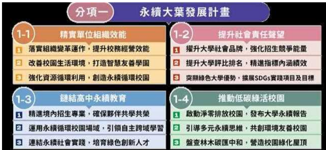
圖(6) 永續大葉發展計畫架構圖