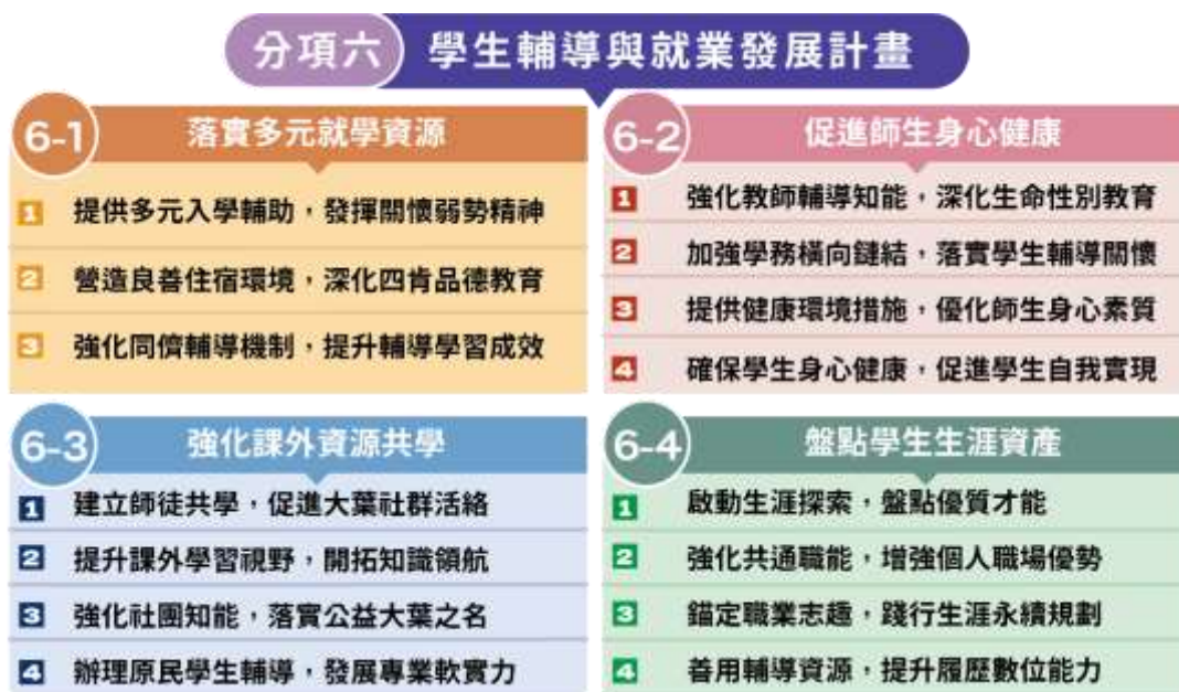
圖(11) 學生輔導與就業發展計畫架構圖