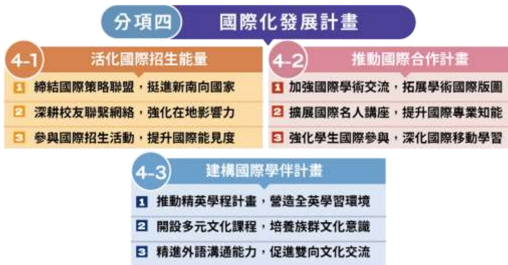
圖(9) 國際化發展計畫架構圖